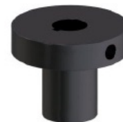
Flange washer 4150 1650 01