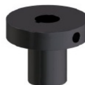
Flange washer 4150 1650 01